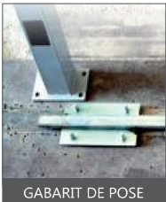
GABARIT DE POSE